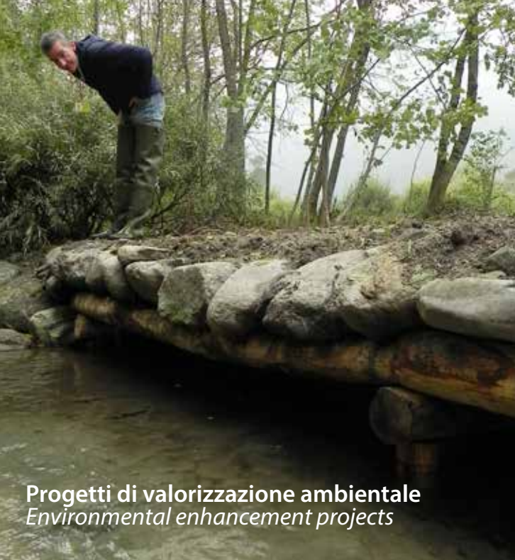
Progetti di valorizzazione ambientale Environmental enhancement projects