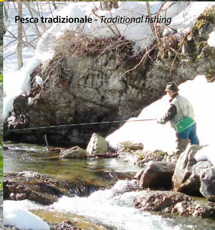
Pesca tradizionale - Traditional fishing

Nel cuore delle Alpi Marittime, sul torrente Gesso, in località Valdieri in Provincia di Cuneo, dove i Reali un tempo, avevano il loro esclusivo "giardino di caccia e pesca" nasce una nuova riserva denominata "IL GESSO DELLA REGINA" dedicata al fly-fishing: 7 km di acque cristalline e una microfauna ricca in un ambiente fluviale integro, un livello d'acqua costante tutto l'anno, una popolazione abbondante di trote fario, marmorate e iridee, un progetto in corso inerente l'immissione del temolo, un Parco Alpino con una ricettività turistica di storica tradizione e uno stabilimento termale protagonista del comprensorio... fanno di questo luogo una meta di grande soddisfazione per il moschista e la sua famiglia.