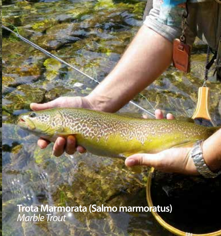
Trota Marmorata (Salmo marmoratus) Marble Trout