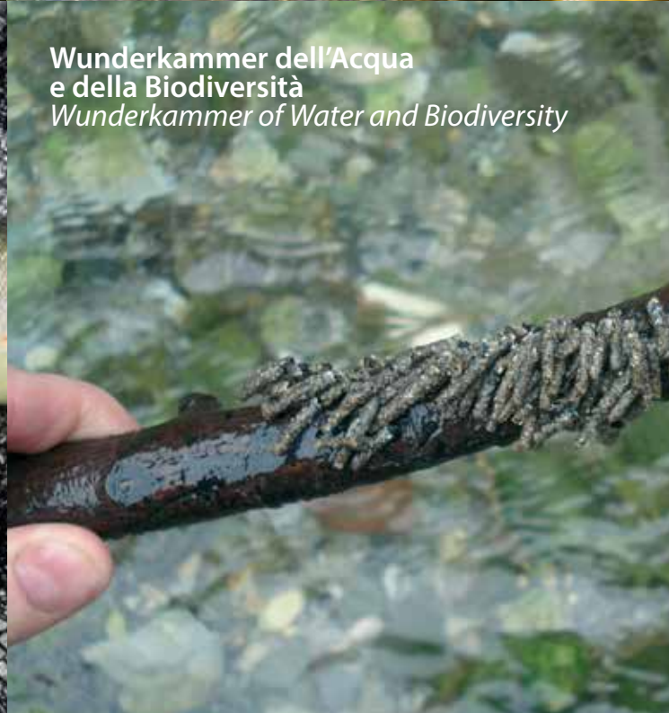
Wunderkammer dell'Acqua e della Biodiversità Wunderkammer of Water and Biodiversity

INFORMAZIONI Tutte le informazioni tramite il sito www.flyfishingvaldieri.it o per telefono: