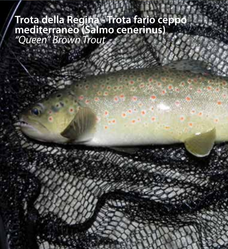
Trota della Regina - Trota fario ceppo mediterraneo (Salmo cenerinus) "Queen" Brown Trout