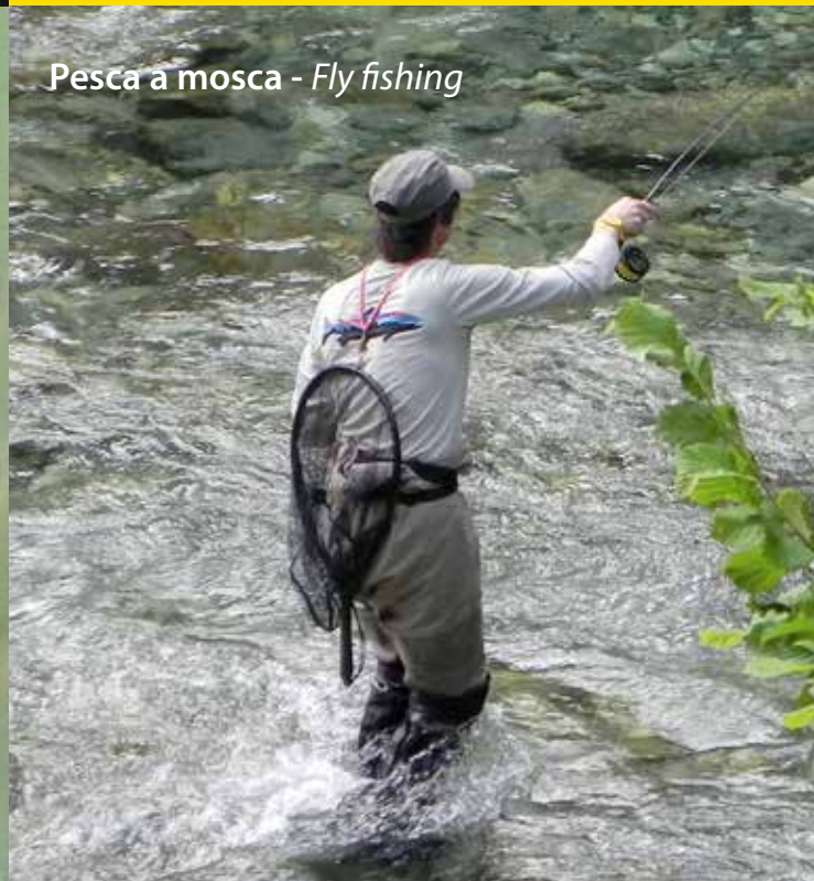
Pesca a mosca - Fly fishing